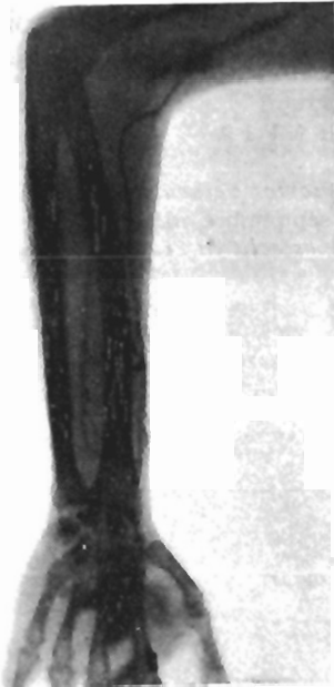
Fig. 2. — Flebografía. Obsérvense los flebolitos en antebrazo

capilar no comprobable a la visión normal. Macroscópicamente las masas musculares se presentaban como si su estructura fibrilar estuviera reducida a una simple tela de araña con infinidad de compartimientos, en cuyo interior se hubiese producido un gran hematoma incoagulable, recubierto el total por la aoneurosis de los diversos estratos de la musculatura antebraquial. Una hemorragia copiosísima, de origen imposible