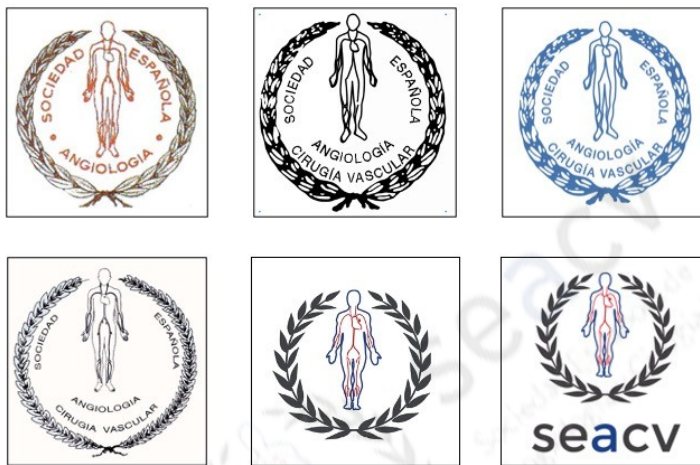
Figura 4. Evolución del emblema de la Sociedad Española de Angiología y Cirugía Vasculat (de izquierda a derecha y de arriba a abajo).

Otro aspecto que deseamos comentar es la evolución histórica del emblema de la sociedad (Figs. 4 y 5).