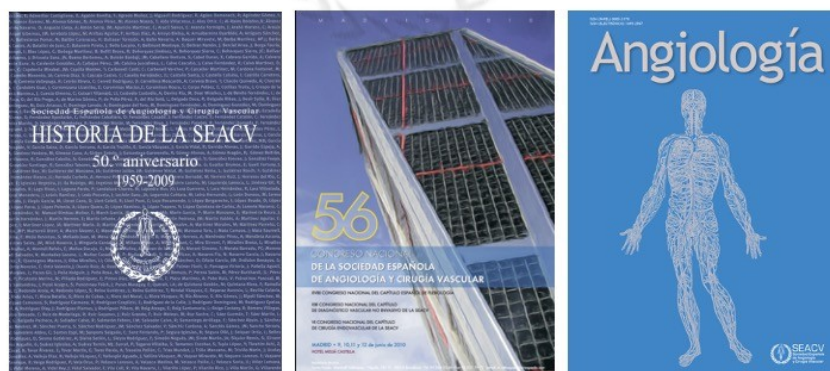
Figura 2. Color corporativo de la Sociedad Española de Angiología y Cirugía Vasculadora: azul claro y oscuro. Ejemplos representativos: portadas y carteles.

Existen diversas tonalidades de azul que pueden unificarse en el azul claro y el oscuro. El primero se asocia con la salud, la comprensión y el alivio, y el segundo, con la verdad, la estabilidad y la seriedad. El color corporativo de la SEACV es el azul e históricamente ambas tonalidades (clara y oscura) se han utilizado por la SEACV en sus diferentes web, carteleras, portadas de libros o revistas, etc. (Fig. 2).