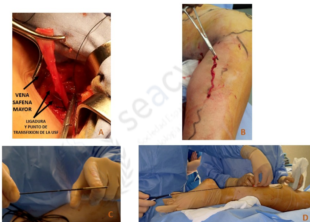
Figura 1. Procedimientos de cirugía clásica, flebectomía y percutánea. A. Ligadura alta o crosectomía de vena safena mayor. B. Flebectomía o extracción de paquetes varicosos. C. Catéter de radiofrecuencia. D. Termoablación. USF: unión safenofemoral. Elaboración propia. Los pacientes dieron su permiso para la difusión de las imágenes.

decisión de la técnica más indicada para cada paciente teniendo en cuenta el riesgo quirúrgico, los factores clínicos y las consideraciones anatómicas y hemodinámicas (8,9). Estos procedimientos pueden realizarse mediante anestesia general, regional o local en función del tipo de procedimiento, de su duración, de las expectativas del paciente y de la experiencia del cirujano (Fig. 1).